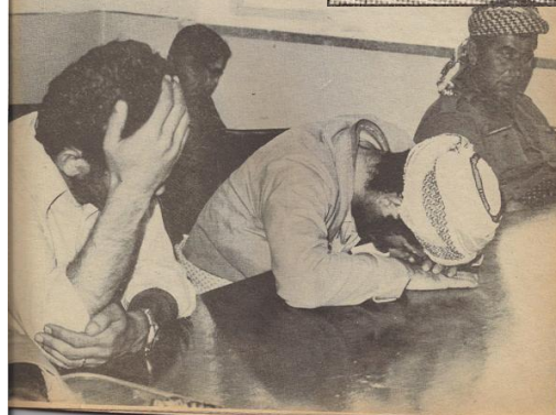
مرداد ۱۳۵۸

رابطه‌ی تشکیلاتی با این سازمان نداشته‌اند.