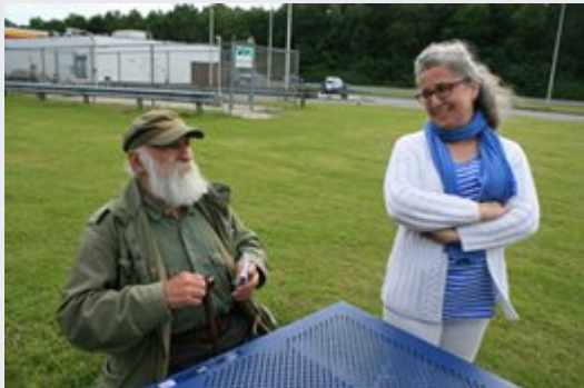
June 21, 2013 at 1:24am · Like · 3