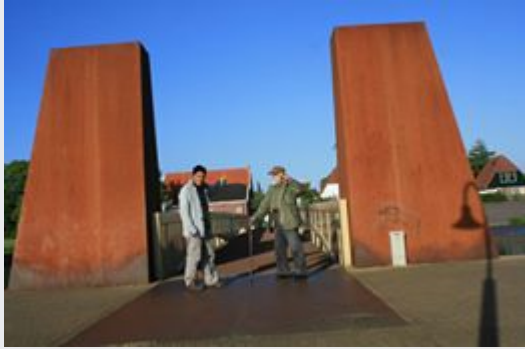
June 21, 2013 at 1:05am · Like · 2