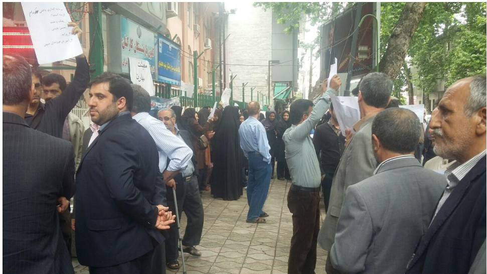
تهران جلوی مجلس